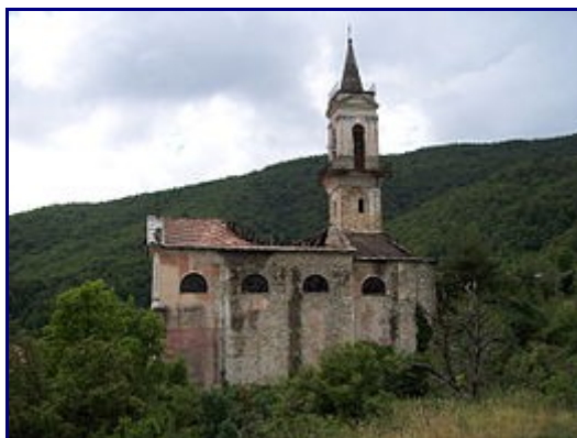
La chiesa di San Ruffino di Cerendero